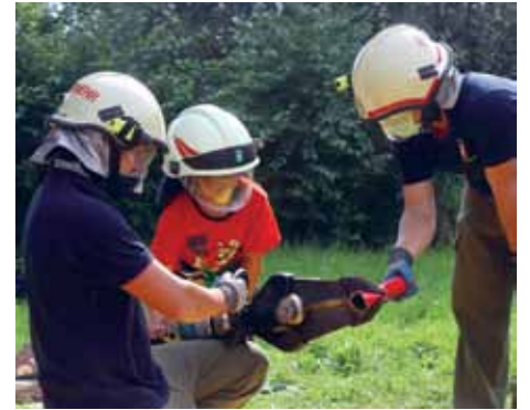
„Ich will Feuerwehrmann werden!“