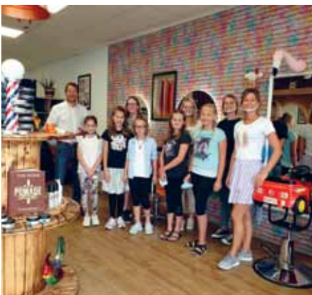
„Im Friseursalon ist etwas los!“