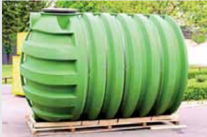
Eine Regenwasserzisterne vor dem Einbau

Für jeden Wassertropfen, den wir verschwenden, müssen wir wissen, dass irgendwo auf der Erde jemand verzweifelt nach einem Wassertropfen sucht.