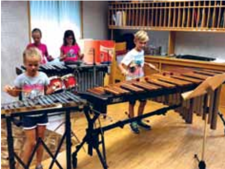
„Welches Musikinstrument liebst du?“