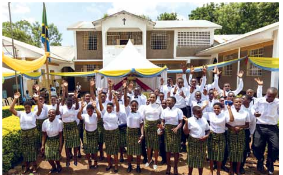
Abschlussfeier der Absolventinnen und Absolventen an der PAPA Bridge Berufsschule, Dezember 2019 Claudia Schanes

Tischler, Maurer, Mechaniker, Schneider und Koch sind nur einige der 10 Berufe, die junge Mädchen und Burschen an der PAPA Bridge Berufsschule in Tansania seit bereits 10 Jahren erlernen können. In Kilema, einem sehr entlegenen Dorf am Fuße des Kilimandscharos, konnte über den Verein PAPA Bridge ( P artnerschaft für A frika mit P ater A idan) allein dank Spendengeldern eine Berufsschule errichtet werden. Auch Bewohnerinnen und Bewohner von Sinabelkirchen haben in den vergangenen Jahren mit Spenden dazu beigetragen, diesen großen Erfolg möglich zu machen, denn bis heute haben es bereits über 1000 Schülerinnen und Schüler geschafft, eine Berufsausbildung zu erhalten. Daher ergeht ein großes Dankeschön an alle unterstützenden Bewohnerinnen und Bewohner von Sinabelkirchen! Durch diese Hilfe wird bewirkt, dass Jugendliche in Tansania ihr Leben zu Hause führen können, ohne ihre Heimat verlassen zu müssen. Information und Spendenmöglichkeit: www.papabridge.com