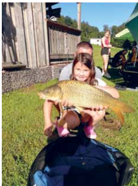
„Hast du auch schon mal so einen großen Fisch gefangen?“