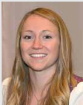
2. Vizebürgermeister Alexandra Schloffer