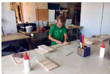
„Ich werde Tischler!“