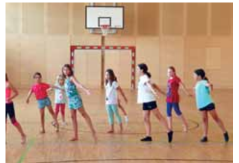
Tanzen für Körper und Geist