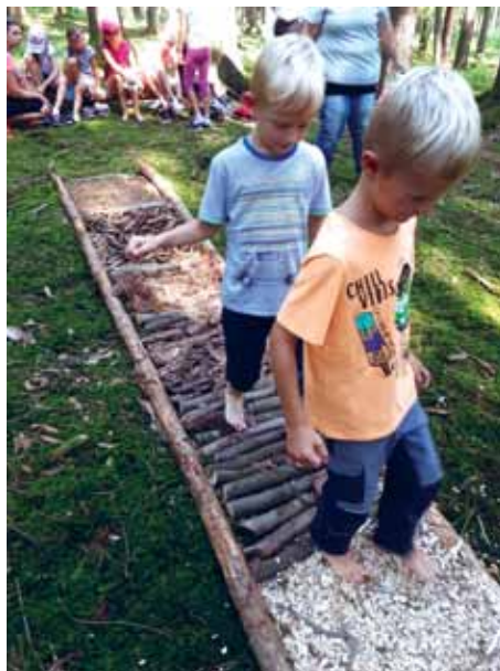
Berg- und Naturwächtertag mit vielen Facetten