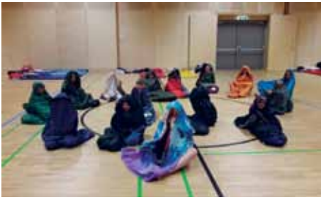
„Lass uns im Turnsaal übernachten!“