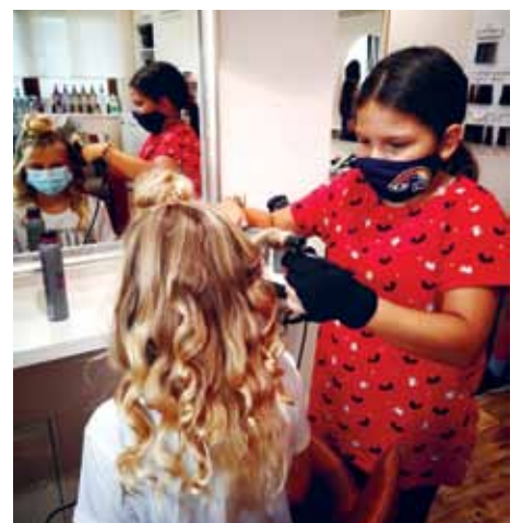
„Ich werde Friseurin!“