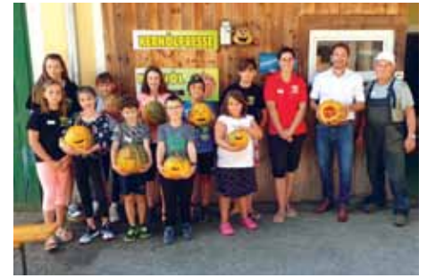
„Wie kommt das Öl aus dem Kürbis?“