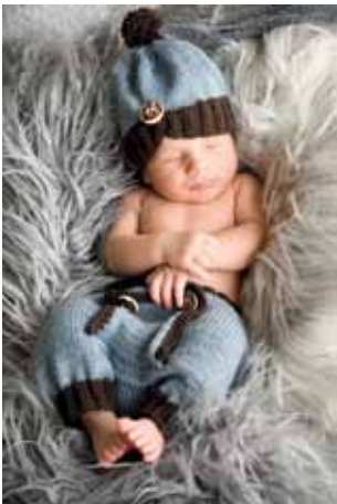
Anton Riemer, Untergroßau